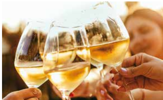
WEIN – die beste Zutat im Rezept unseres Lebens!